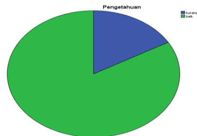
Gambar 1. Distribusi pengetahuan responden tentang gizi 1000 hari pertama kehidupan

Berdasarkan gambar 1 diketahui bahwa sebagian besar pengetahuan reponden tentang gizi 1000 hari pertama kehidupan adalah baik. Hal ini merupakan awal yang baik bagi kehidupan janinya karena ibu hamil sudah ahu tentang gizi yang baik selama 1000 hari pertama kehidupan. Karena diharapkan dengan pengetahuan yang baik ini akan membentuk sikap yang baik juga bai ibu terhadap gizi 100 hari pertama kehidupan janinnya.